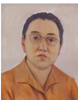
ИСАБАЕВА Валентина Абдылдаевна –

КММИнин 1962–1971-жылдардын ортосундагы ректору. 200дөн ашуун илимий эмгектердин, анын ичинде 13 монографиянын автору. Анын жетекчилиги менен илимдин 4 доктору жана 13 кандидаты даярдалган. Кыргыз Республикасынын Илимдер Академиясынын мүчө-корреспонденти, республикабыздын илимине эмгек сиңирген ишмер. В. И. Исабаева «Эмгек Кызыл Туу» ордени, медалдар, Кыргыз ССР Жогорку Советинин Ардак грамотасы жана башка сыйлыктар менен сыйланган.