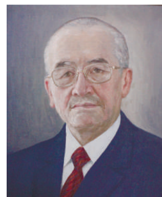
ЗУРДИНОВ Аширалы Зурдинович –

2009–2016-жылга чейин КММАнын ректору болуп иштеген. Кыргыз Республикасынын Улуттук илимдер академиясынын мүчө-корреспонденти, Эл аралык информатизация академиясынын академиги, Кыргыз Республикасынын илимине эмгек сиңирген ишмер, Ректорлордун европалык клубунун мүчөсү.